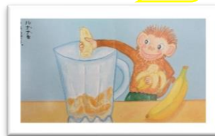
『ともだちジュース』より