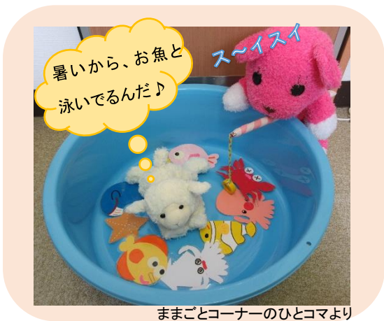
ままごとコーナーのひとつより

みなさんお元気ですか。季節は夏。オリンピックも折り返し地点までやってきました。みなさんは、テレビの前で何の競技にエールを送っていますか？選手のみなさんの懸命な頑張り、輝く汗やきれいな涙には、ただただ感動をもらっている方もたくさんいらっしゃることでしょ。けれど、懸命な美しい姿といえ、みなさん子育て時間を進めておられる親御さんたちも同じです。その親御さんたちにとって、センター開放は、お子さんと一緒に安心して出かけることができるとても大切な場所でありま。緊急事態宣言、アラート発令、ステージレベルなど、ニュースには緊張が走る毎日ですが、子育て家庭の親御さんたちがいつも通り過ごせ、心の元気や頑張るエネルギーを蓄える場所として、センターの穏やかな時間を守りたいものです。また、遊びにいらした時には、あなたの頑張りがちゃんとお子さんに届いていると感じれるような出会いになればと思っております。よかったら、あなたのかわいいお子さんをお連れになって、センターにあそびにいらしてくださいね。